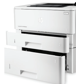
HP LaserJet Pro M402dn opcionális 550 lapos tálcával