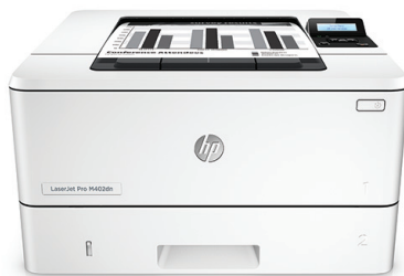
HP LaserJet Pro M402dn

A munkastílusára szabott nyomtatási teljesítmény és erőteljes biztonság. Ez a sokoldalú nyomtató gyorsabban elvégzi a feladatokat, és átfogó biztonsági szolgáltatásai révén véd a fenyegetésektől. 1 A JetIntelligence technológiás eredeti HP tonerkazettákkal több oldal nyomtatható. 2